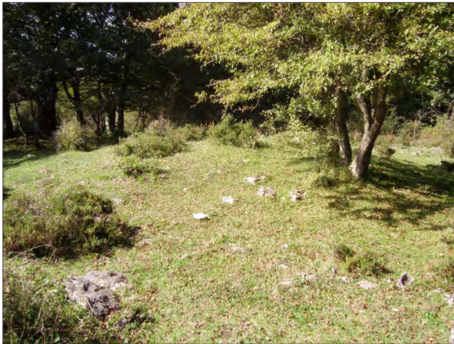
Dolmen Lejazar Septentrional.

(BARANDIARAN, 1932); (APELLANIZ, 1973); (CIPRES et alii 1978); (CC.AA, 1987).