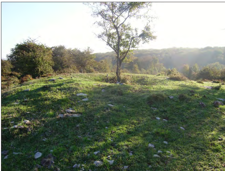
Dolmen de Lejazar Meridional.

(BARANDIARAN, 1932); (APELLANIZ, 1973); (CIPRES et alii. 1978); (CC.AA, 1987).