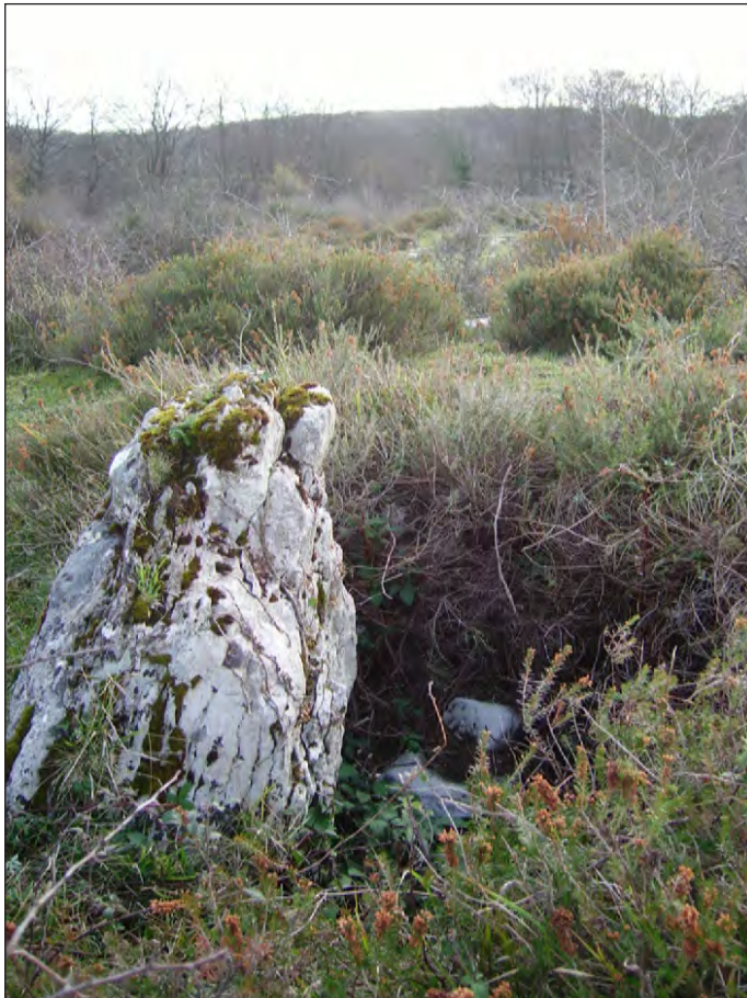
Dolmen Alto de Lejazar.