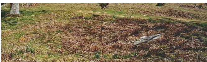
02 de marzo de 1.999