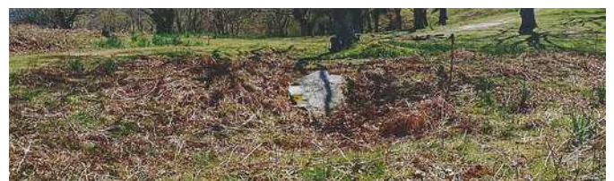
02 de marzo de 1.999