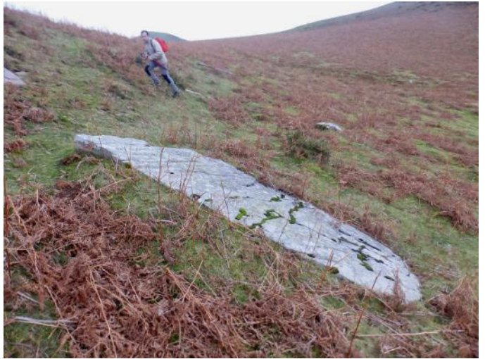
13 de Diciembre de 2.014.