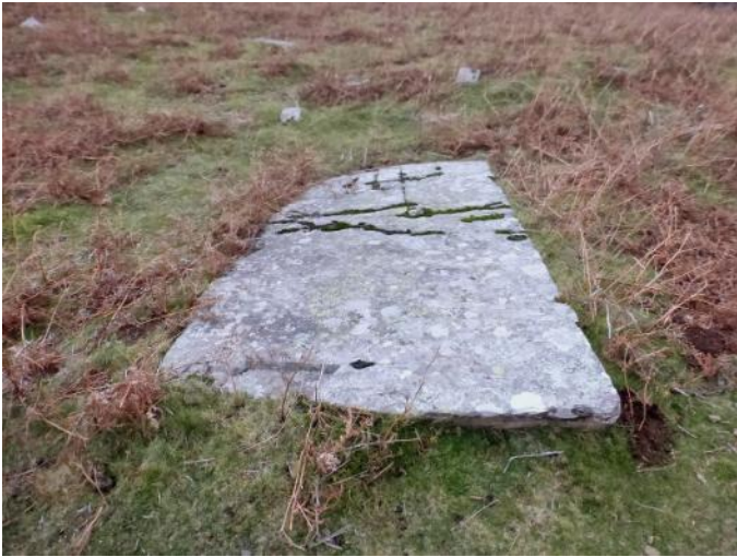
13 de Diciembre de 2.014.