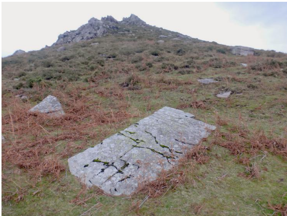
13 de Diciembre de 2014.