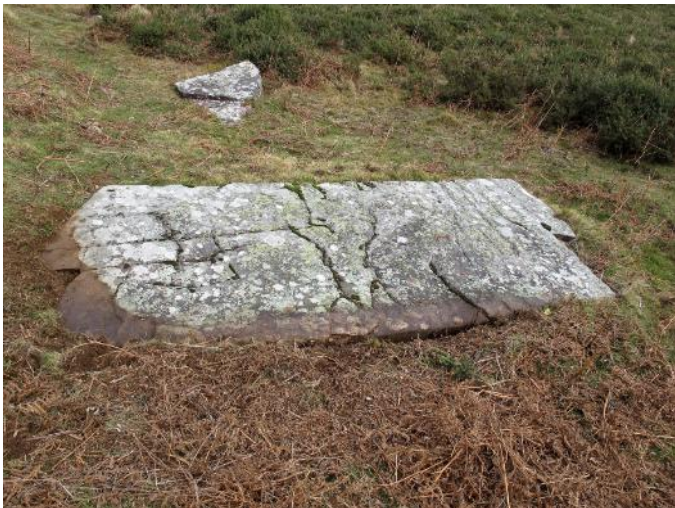
29 de Diciembre de 2.021.