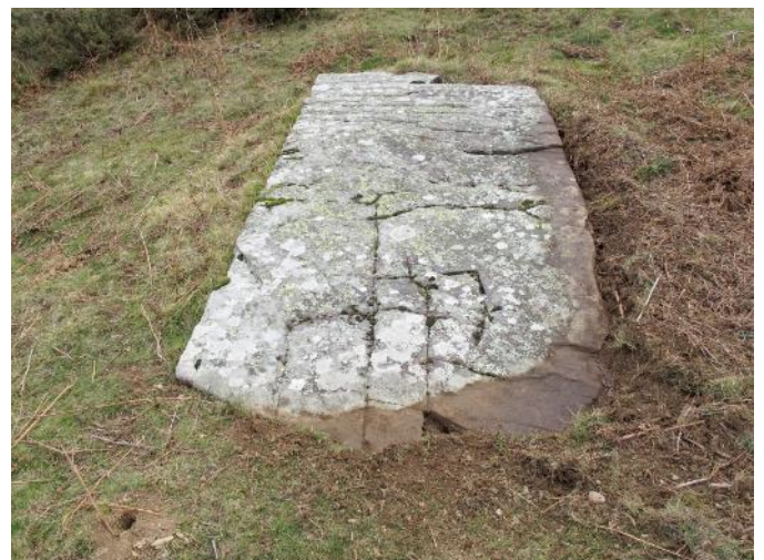
29 de Diciembre de 2.021.