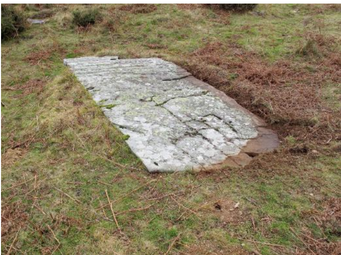
29 de Diciembre de 2.021.