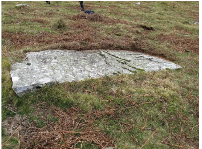
29 de Diciembre de 2.021.