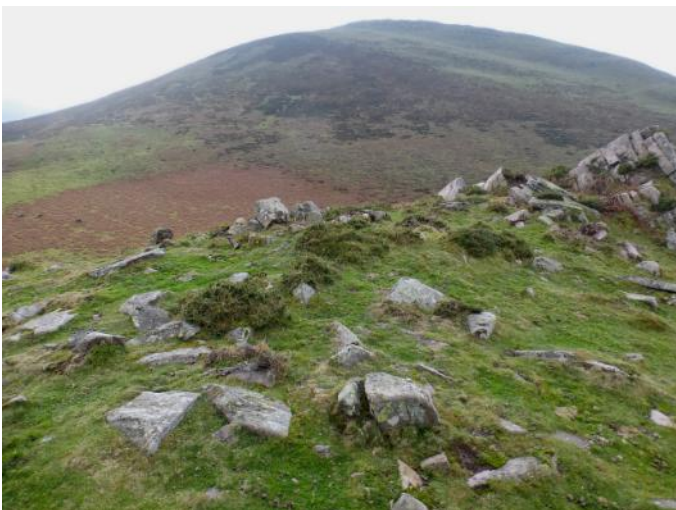
13 de Diciembre de 2014.