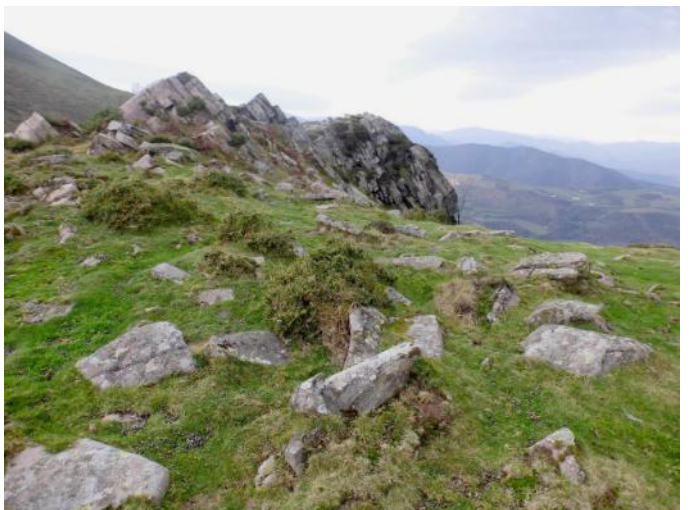
13 de Diciembre de 2014.