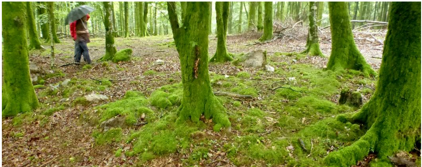
15 de Agosto de 2.015.