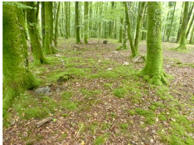
15 de Agosto de 2.015.