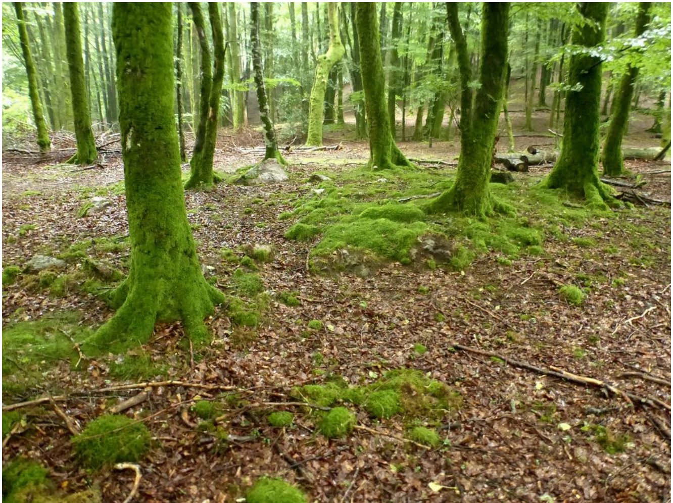
15 de Agosto de 2.015.