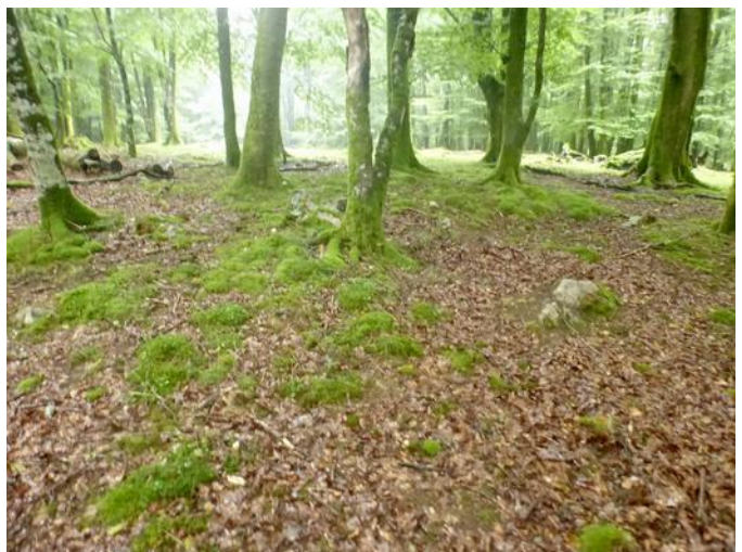
15 de Agosto de 2.015.