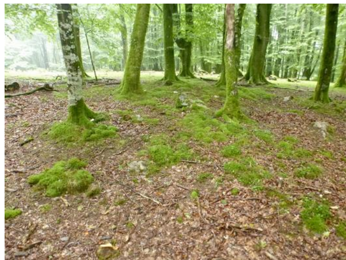
15 de Agosto de 2.015.