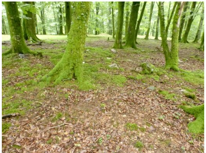
15 de Agosto de 2.015.