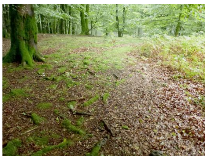
15 de Agosto de 2015.