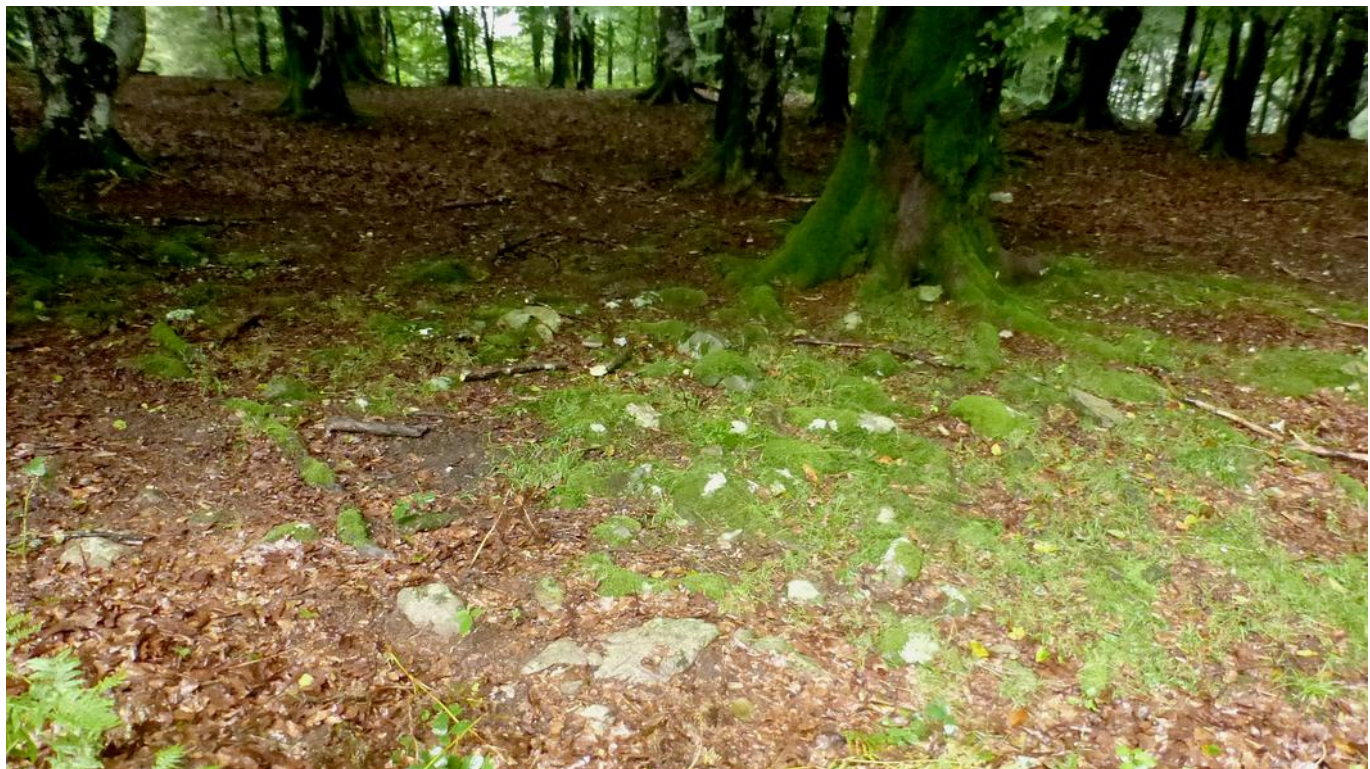
15 de Agosto de 2.015.