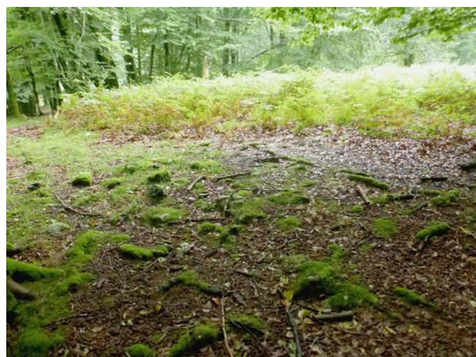
15 de Agosto de 2.015.