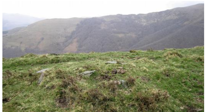
03 de Abril de 2.010.