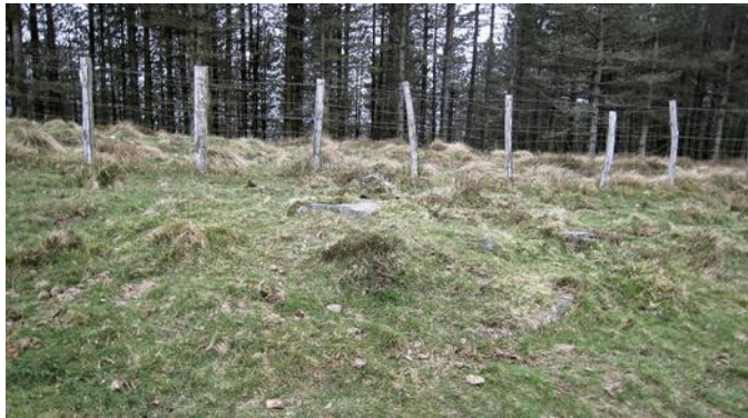
03 de Abril de 2.010.