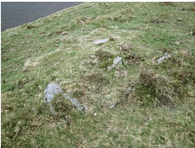
03 de Abril de 2.010.