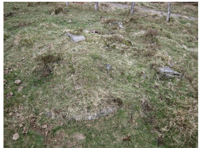
03 de Abril de 2.010.