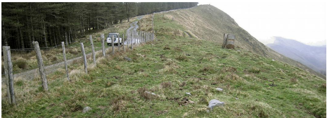
03 de Abril de 2.010.